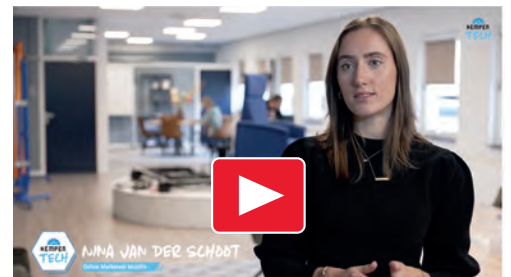
Op bezoek bij Multifix.