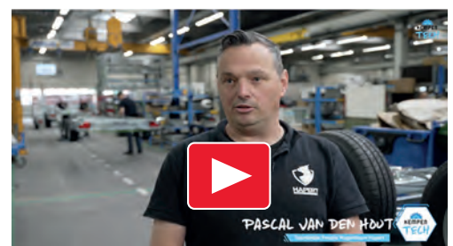
Op bezoek bij Wagenbouw Hapert.