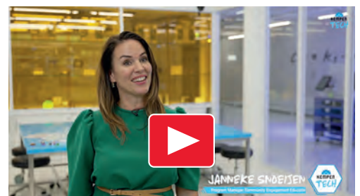
Op bezoek bij ASML.